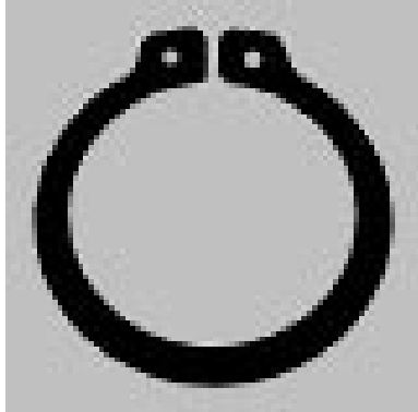
A400X 6 DIN 471 SEEGER - Sicherungsring für Welle DIN 471 Seeger-Ring für Wellen